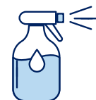
Je mouille mon corps