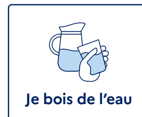
Je bois de l'eau