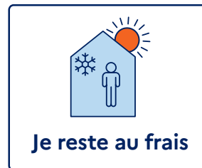
Je reste au frais