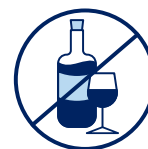
J'évite de boire de l'alcool