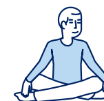
Je fais des activités sans effort